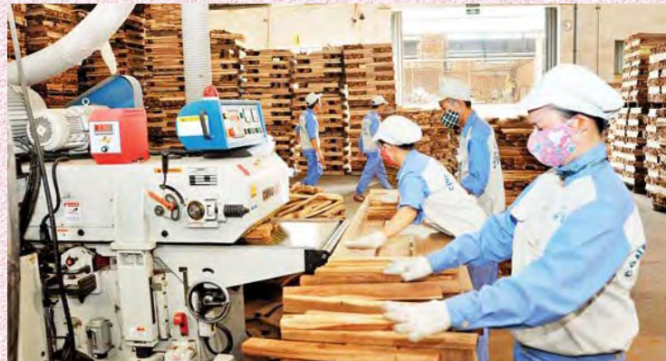
Một cơ sở chế biến lâm sản

- Được Nhà nước bảo đảm quyền và lợi ích hợp pháp; hỗ trợ liên kết chuỗi sản xuất, chế biến; áp dụng chính sách phát triển chế biến lâm sản và pháp luật về đầu tư, doanh nghiệp trong khu vực nông thôn, nhất là khu vực vùng sâu, vùng xa.